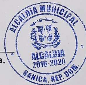
Licda. Yissell Y. Santana Alcántara. Alcaldesa Municipal